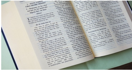
Foto: Bijbel in de Bomu San taal, van Pater Bloemarts (†) uit Milsbeek, die hieraan heeft meegewerkt.

De United Bible Societies (UBS) heeft maandag 11 mei in Stuttgart haar “Translation Statistics 2025” gepresenteerd. Daaruit blijkt dat de Bijbel inmiddels geheel of gedeeltelijk in 4121 talen beschikbaar is. Voor ongeveer 6,6 miljard mensen is de Bijbel volledig beschikbaar in hun moedertaal.